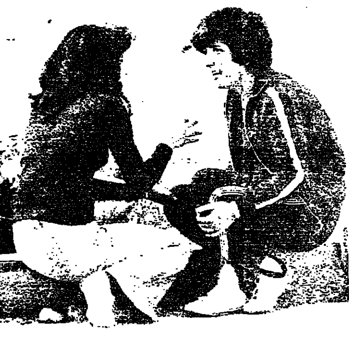
مشاورات بين مرشحين

دار المعلمين للتربية الرياضية تشهد هذا العام انخفا كبيرا من حيث الاعداد المقدمة . فقد جرت منذ يومين وللمرة الاولى بعد الاحداث اول امتحانات قبول للسنه الاولى ، تقدم اليها ٥٠ طالب وطالبة لترشح منهم فعليا ٣٠٠ ، على الاسئلة كالتالي وعلى الطريقة ان يتم اختيار ٣٠ فتاة و ٣٠ شابا ، الا ان عدد المتقدمين ١٥٥ سؤالا تكون اجوبتهم بنص او لا . وامس جرت الامتحانات التطبيقية للطلاب في الهيئة الرياضية ، واليوم تجري لجان في الهيئة الرياضية ايضا . وتتوالى الامتحانات التطبيقية ، المتحارون الرياضية على مختلف انواعها من ركض وجيبار وتفرع عال . ويتوقع ان يكون عدد الفائزين لا يبالى به ، خصوصا وان اسلوب الامتحانات المتقدم هو اميركي ، وهذا الاسلوب مستحب لدى الطلاب ، وسهل كما انه يعطي صورة واضحة عن معرفة الطالب .